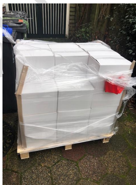
pallet met 50.000 folders